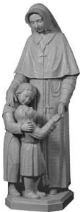
Santa Claudina Thévenet Fundadora de Jesús - Maria